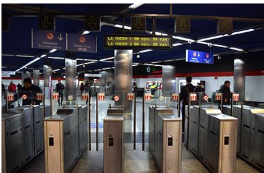
Con puertas correderas.

Los tornos de las estaciones tienen estas formas: