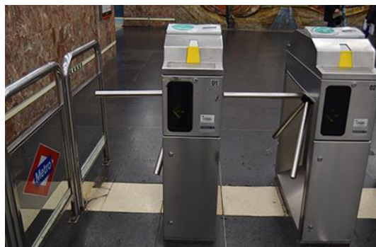
Con torno giratorio de paso.